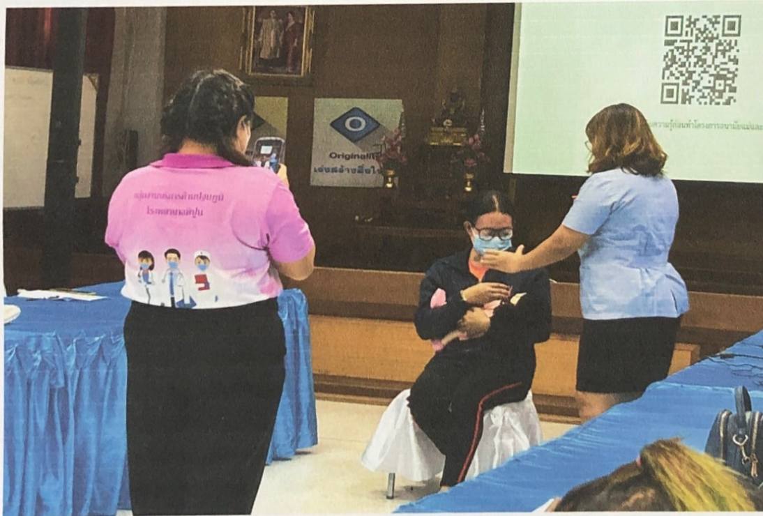
เทคนิคการสอน การเลี้ยงลูกด้วยนมแม่/การอุ้มทารกให้กินนมแม่